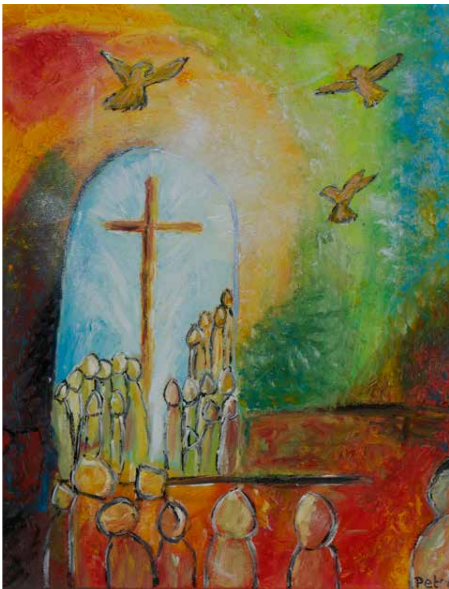
'Verbonden in geloof', Petra Boersma